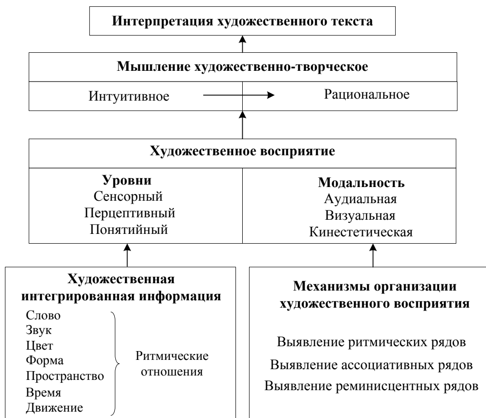
Рис. 1. Модель развития художественно-творческого мышления